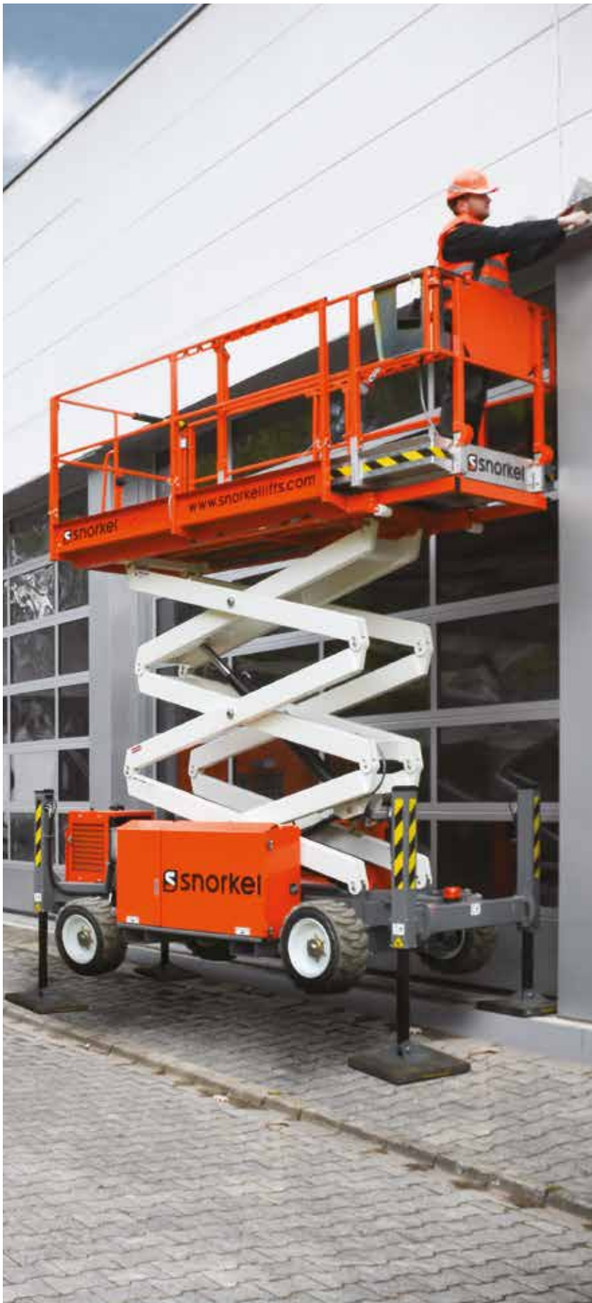
PLATE-FORME CISEAUX TOUT TERRAIN ÉTROIT